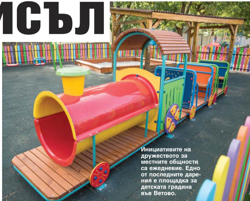
Инициативите на дружеството за местните общности са ежедневие. Едно от последните дарения е площадка за детската градина във Ветово.

За компанията инвестициите в подобряване на работните места са нещо обичайно. Същото важи и за допълнителни